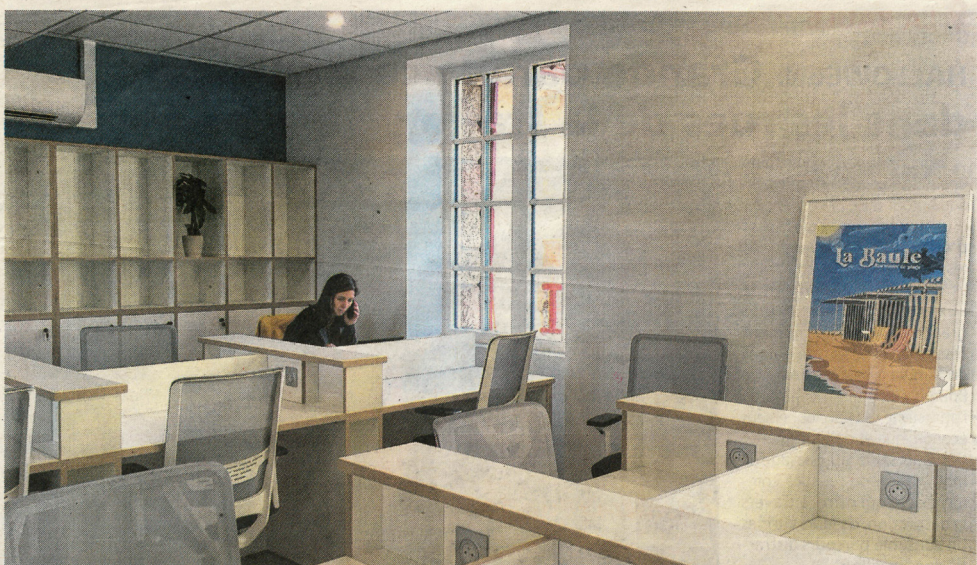
L'espace de coworking ouvert de LA GARE comprend 24 îlots individuels